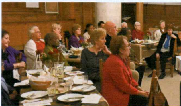
Aandacht voor het Kerstverhaal