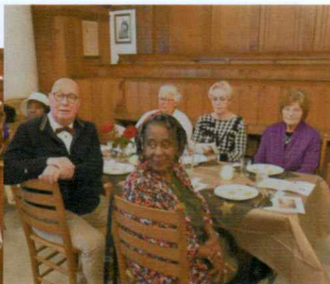
Gasten uit Het Gooi en van de EBG